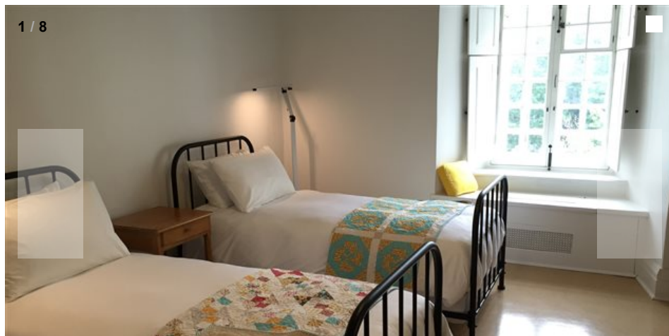
Le Monastère des Augustines reconverti ouvrira officiellement ses portes le 1er août.